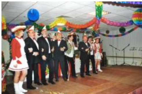
...unser Elferrat mit Sitzungspräsident