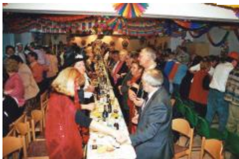
...Saal und Ehrengäste